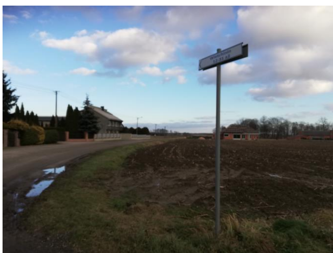
Tablica z numerami posesji