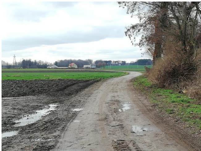
Drogi dojazdowe asfaltowe i gruntowe