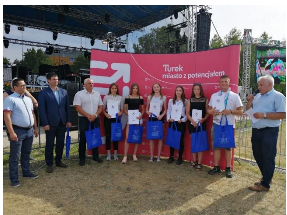
Dni Turku i Gminy Turek