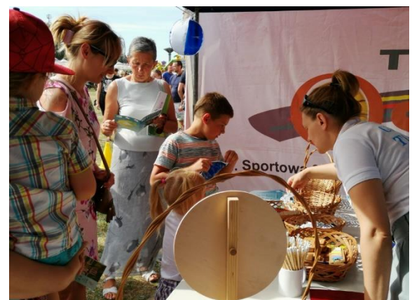
Dni Turku i Gminy Turek