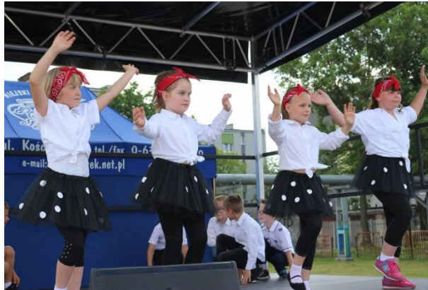
Dzień Dziecka i Rodziny