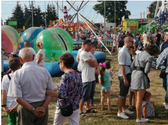
Dni Turku i Gminy Turek