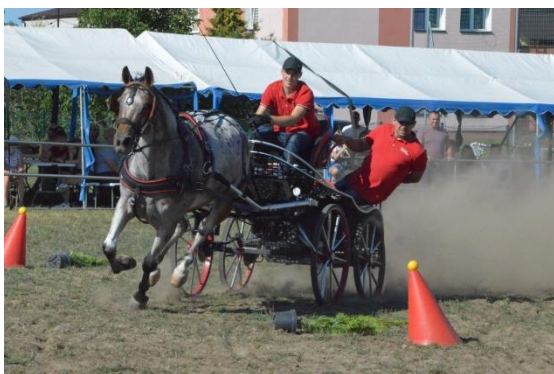
Gminne Zawody Konne