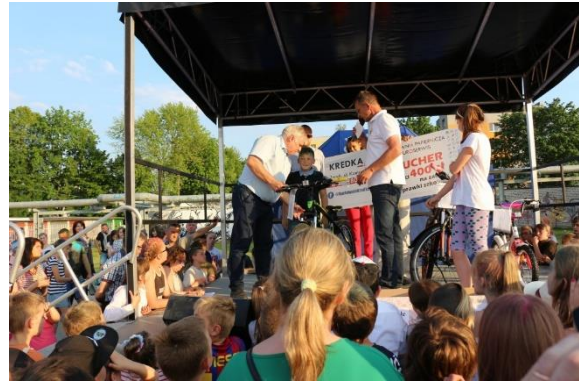
Dzień Dziecka i Rodziny