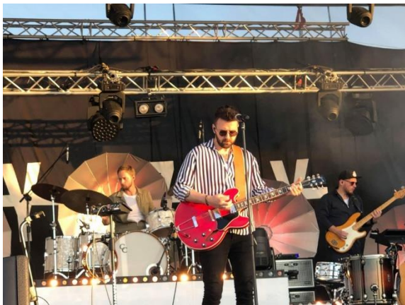
Dni Turku i Gminy Turek