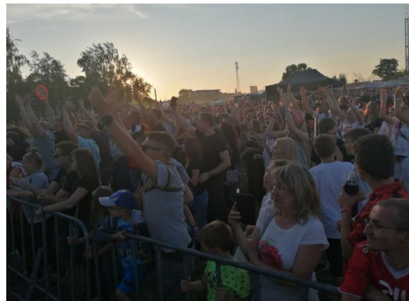
Dni Turku i Gminy Turek