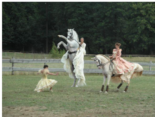
Gminne Zawody Konne