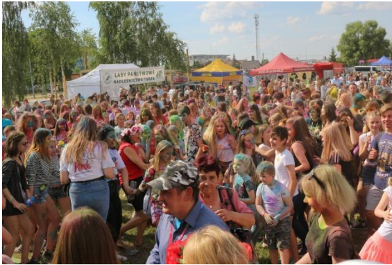
Dzień Dziecka i Rodziny