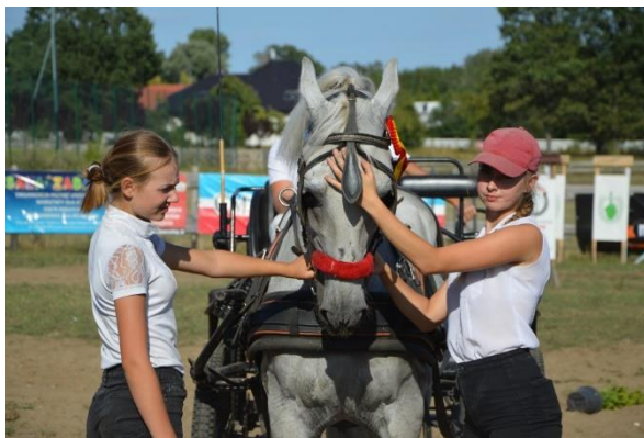
Gminne Zawody Konne