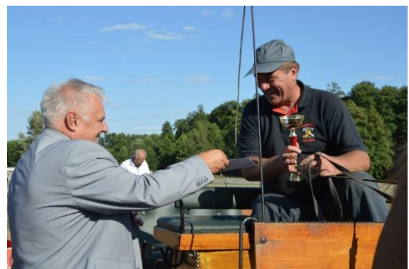
Gminne Zawody Konne